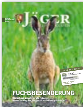
Titel dieser Ausgabe: Hase im Getreidefeld