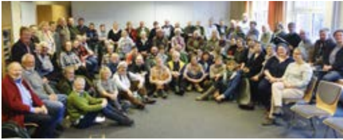
▲ Teilnehmer und Ausbilder des Bläserseminars