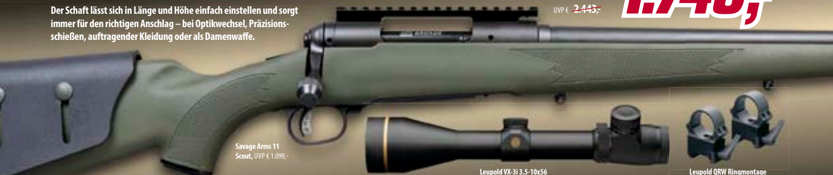
Savage Arms 11 Scout, UVP € 1.099,-