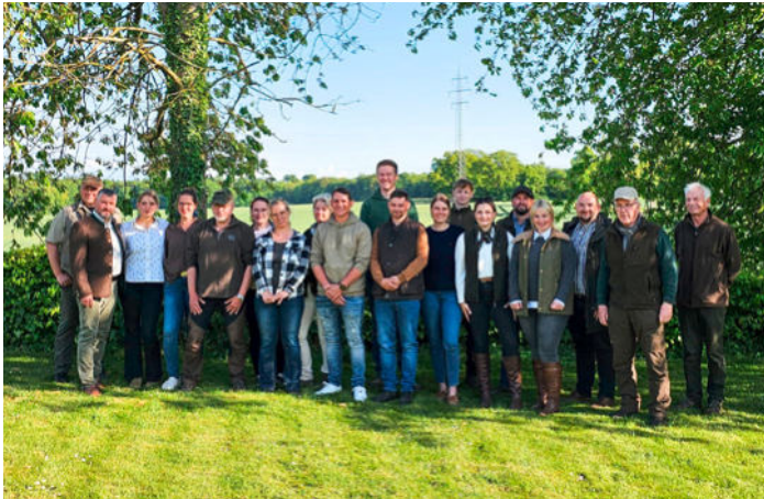
Jungjäger des Winterlehrgangs der Kreisjägerschaft Oldenburg.

die Theorie nicht zu kurz kommen und so erfuhren wir auch einiges über die Fütterung, Pflege und die Voraussetzungen zum Halten dieser Tiere.