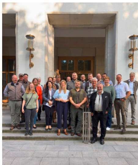
Der erweiterte Vorstand der Kreisjägerschaft Rendsburg-West vor dem Landtag