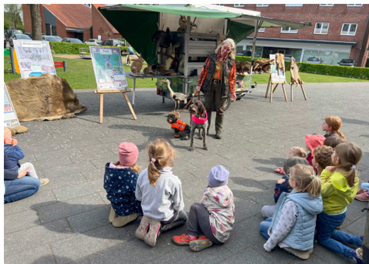
Das Wildtier-Mobil der Kreisjägerschaft Segeberg machte Halt am Familienzentrum Nahe, um den Kindern die heimische Tier- und Pflanzenwelt näher zu bringen