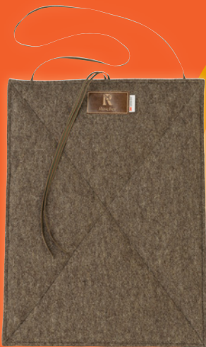
Sitzkissen Loden im Wert von 79,- €