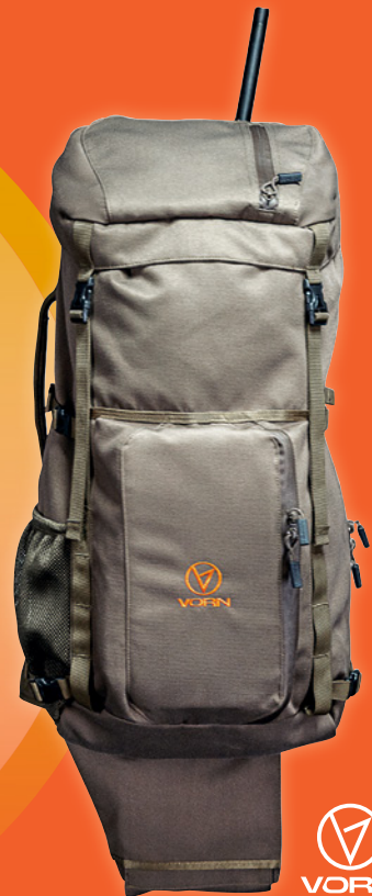
Rucksack EV45 im Wert von 398,- €