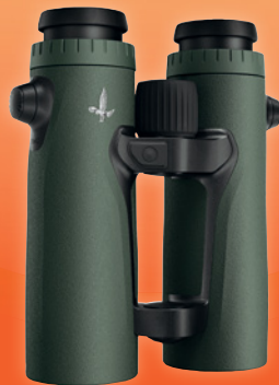
Optik Fernglas mit Entfernungsmesser EL Range 10x42 WB im Wert von 3.300,- €