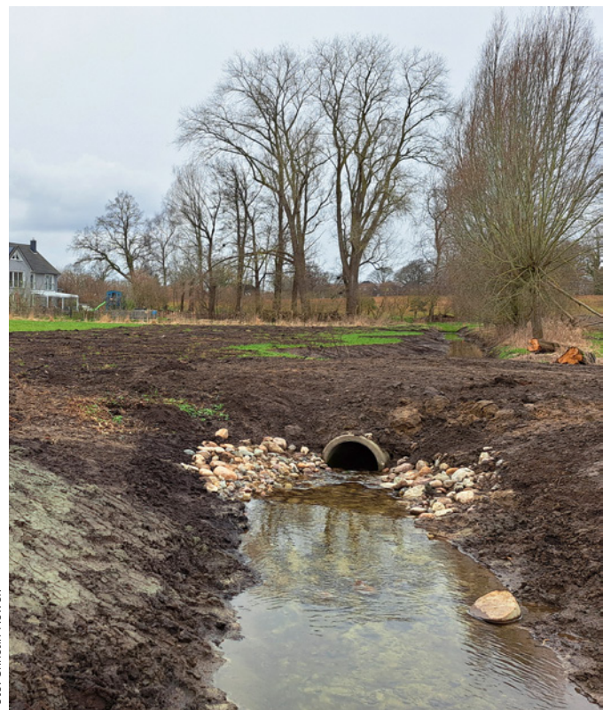
Geöffneter Graben Heitholm