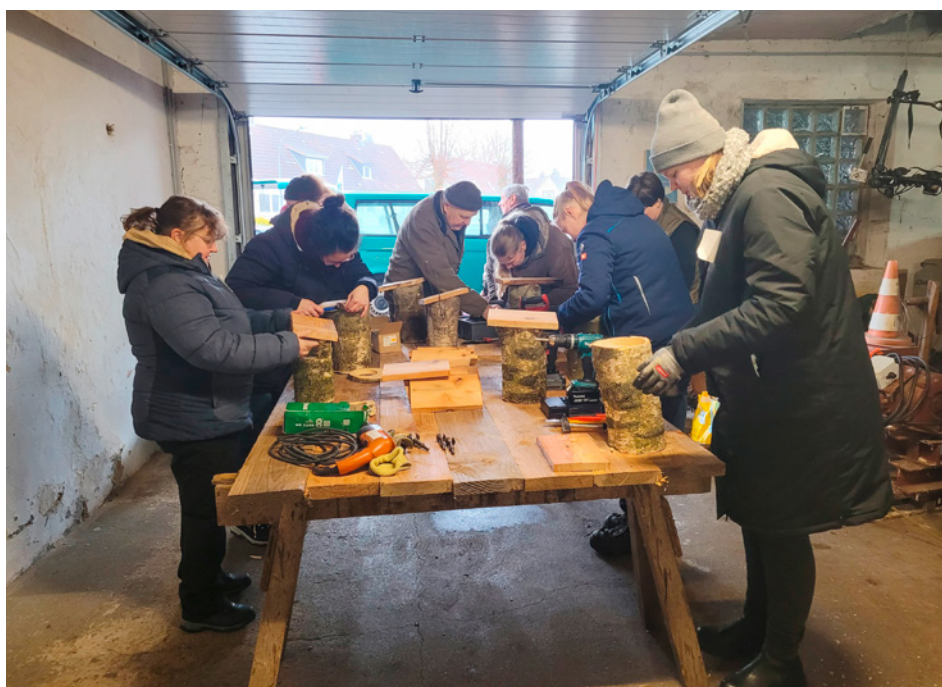
Gemeinsam ans Werk – Landfrauen und Jäger bastelten Nistkästen und sorgten so für gute Brutbedingungen von unterschiedlichen Vogelarten.